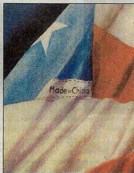
Made in China (Hecho en China).

La Estatua de la Libertad es una constante en la obra de Manzano. A la izq, Oxígeno, en el centro, A Tear for Hope (Una lágrima por la esperanza) y a la der., Is Justice Blind?, (¿Es la justicia ciega?).